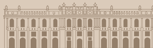
MUSEO NACIONAL DE ARTE

Por la belleza de su arquitectura palaciega, calidad de sus exposiciones y la constante relectura de sus colecciones, EL MUNAL es una visita agradable para todas aquellas personas que deseen conocer y profundizar en la historia del arte en México.