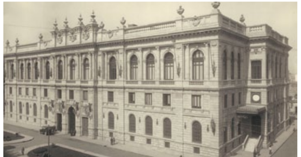
Vista del Antiguo Palacio de Comunicaciones y Obras Públicas, ca. 1910

“Enfrente de la magnífica Escuela de Minería, edificio que es honra de la arquitectura colonial y que es un monumento constante del amor de la madre patria a su hija predilecta, se levanta orgulloso y soberbio, pregonando las glorias artísticas del Méjico independiente, el espléndido Palacio del Ministerio de Comunicaciones, verdadera maravilla arquitectónica, decorado bella y suntuosamente por el notable artista español Antonio Salarich, que justifica plenamente el nombre que dio Humboldt a nuestra insigne ciudad. La pasión política no podrá negar al gobierno del preclaro general Díaz el mérito de haber hecho de Méjico una hermosa ciudad, cuyo embellecimiento tanto nos enorgullece.”