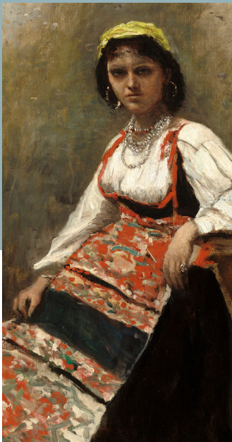
Jean Baptiste Camille Corot, Muchacha Italiana, ca. 1872, National Gallery of Art, Washington, Gift of the Avalon Foundation, 1954