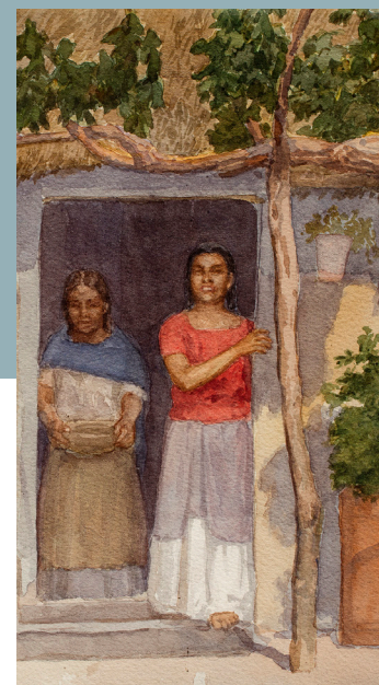
Leandro Izaguirre, Tehuana, último tercio del siglo XIX, Museo Nacional de la Acuarela Alfredo Guati Rojo