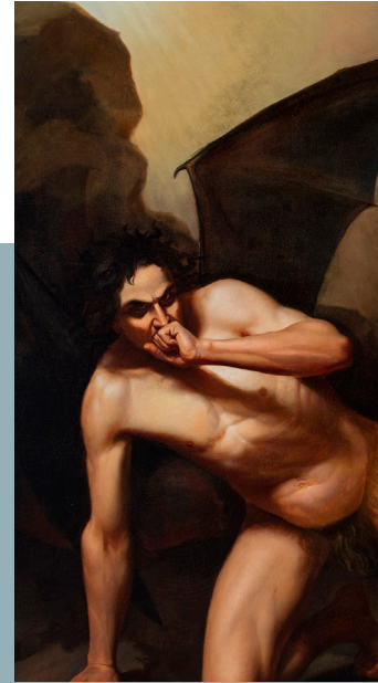
Felipe Santiago Gutiérrez, La caída de los ángeles rebeldes, 1850, Universidad Autónoma del Estado de México