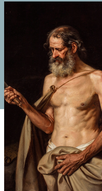
Felipe Santiago Gutiérrez, San Bartolomé, ca. último tercio del s. XIX, Museo Nacional de Arte, Acervo Constitutivo, 1982