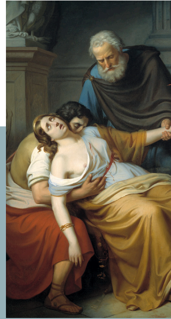
Felipe Santiago Gutiérrez, El juramento de Bruto, 1857, Museo Nacional de Arte, Acervo Constitutivo, 1982