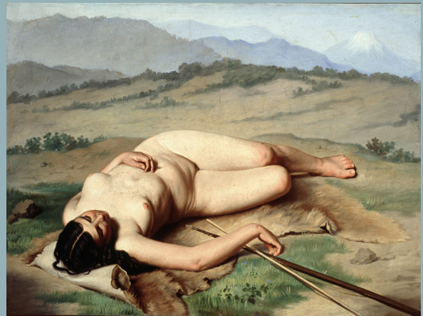
Felipe Santiago Gutiérrez, La cazadora de los Andes , ca. 1891, Museo Nacional de Arte, Acervo Constitutivo, 1982