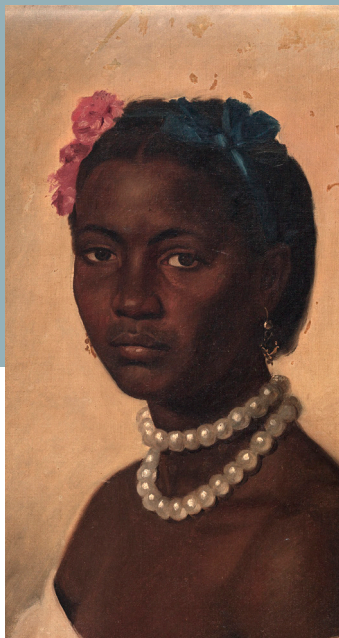
Felipe Santiago Gutiérrez, Retrato de mulata, 1875, Colección Proyecto Bachué- Colombia