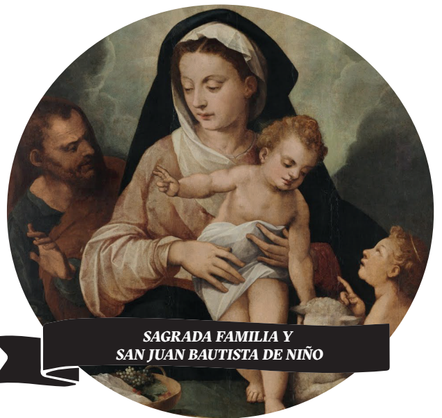
SAGRADA FAMILIA Y SAN JUAN BAUTISTA DE NIÑO

De vuelta a Belén, después de la huida a Egipto, la Sagrada familia se detuvo en la casa de Isabel. El pequeño San Juan, como si comprendiera demuestra respeto a Jesús.