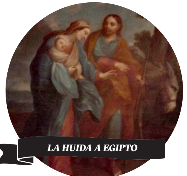
LA HUIDA A EGIPTO

Un ángel le informó a José, en un sueño, “Herodes ha de buscar al niño para matarle”. José se levantó en la noche, tomó a la madre y al niño y se retiró a Egipto.