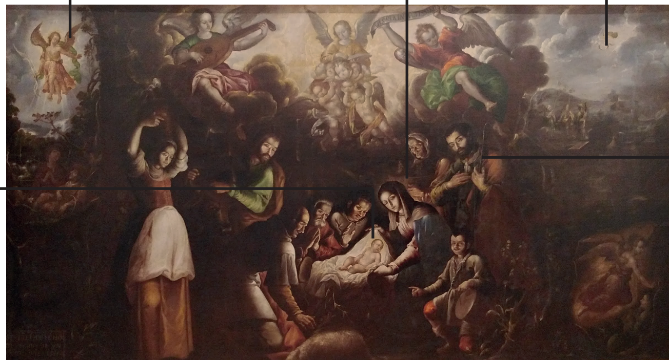
LA ADORACIÓN DE LOS PASTORES Pedro Ramírez

Borrego: Sacrificio. Se relaciona con la sangre de Jesús y el guía de Cristo.