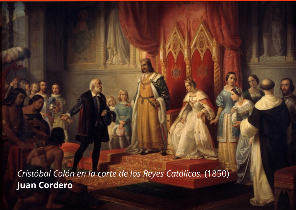
Cristóbal Colón en la corte de los Reyes Católicos. (1850)