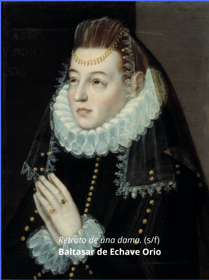
Retrato de una dama. (s/f) Baltasar de Echave Orio