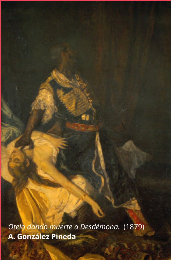
Otelo dando muerte a Desdémona. (1879) A. González Pineda