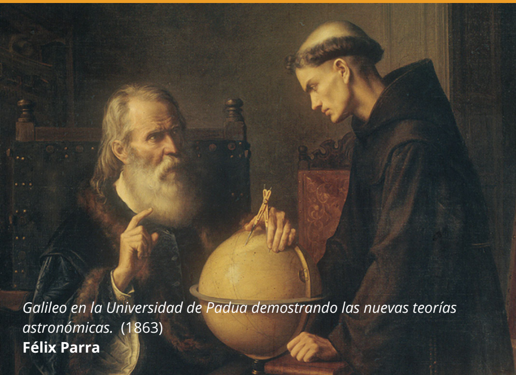
Galileo en la Universidad de Padua demostrando las nuevas teorías astronómicas. (1863)