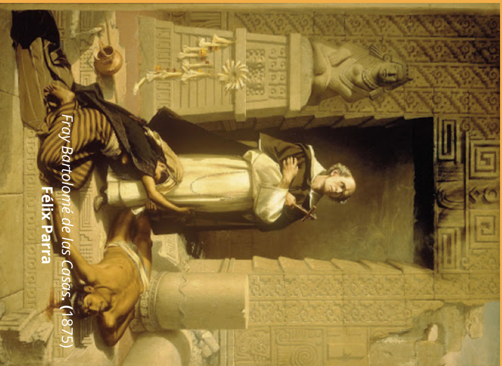
Fray Bartolomé de las Casas. (1875) Félix Parra