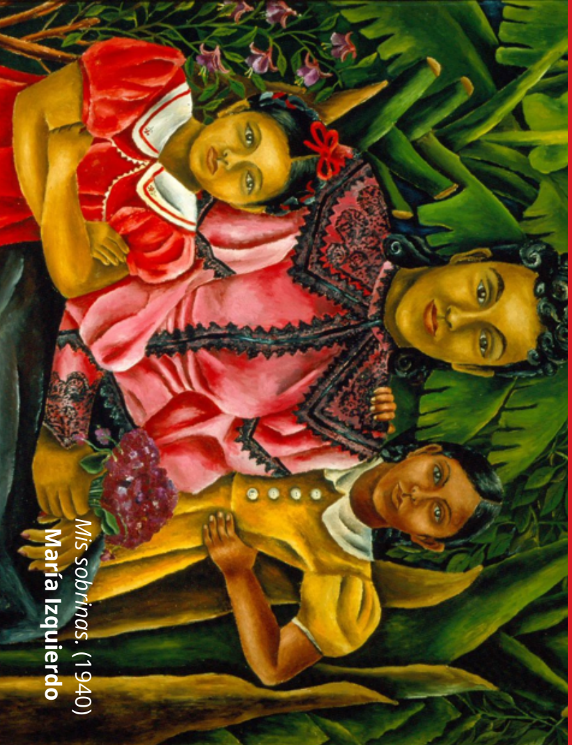
Mis sobrinos. (1940) María Izquierdo

01 ¿Qué pasa con aquellos cuerpos que están en rebeldía, que cruzan la barrera de género, los no binarios y los que están en el cruce de interseccionalidades?