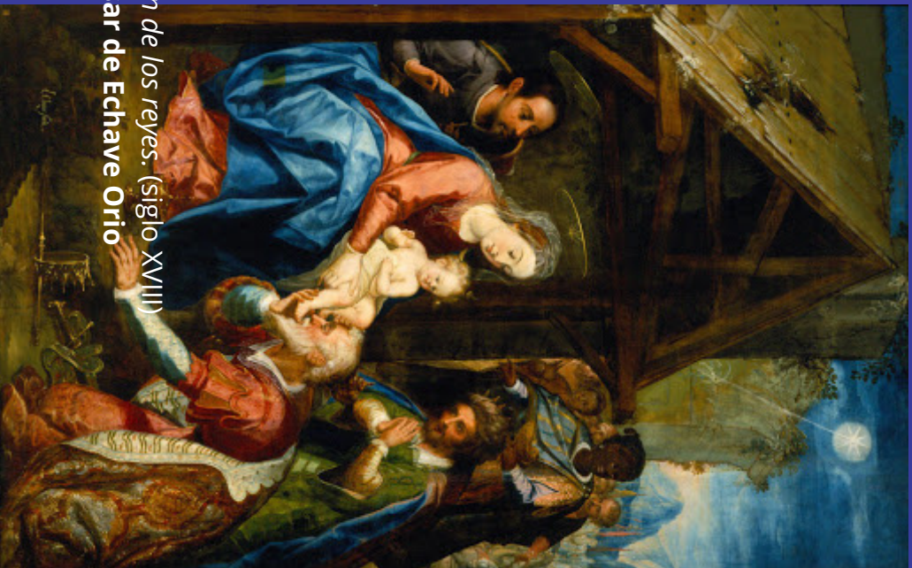
La adoración de los reyes. (siglo XVIII) Baltasar de Echave Orrio