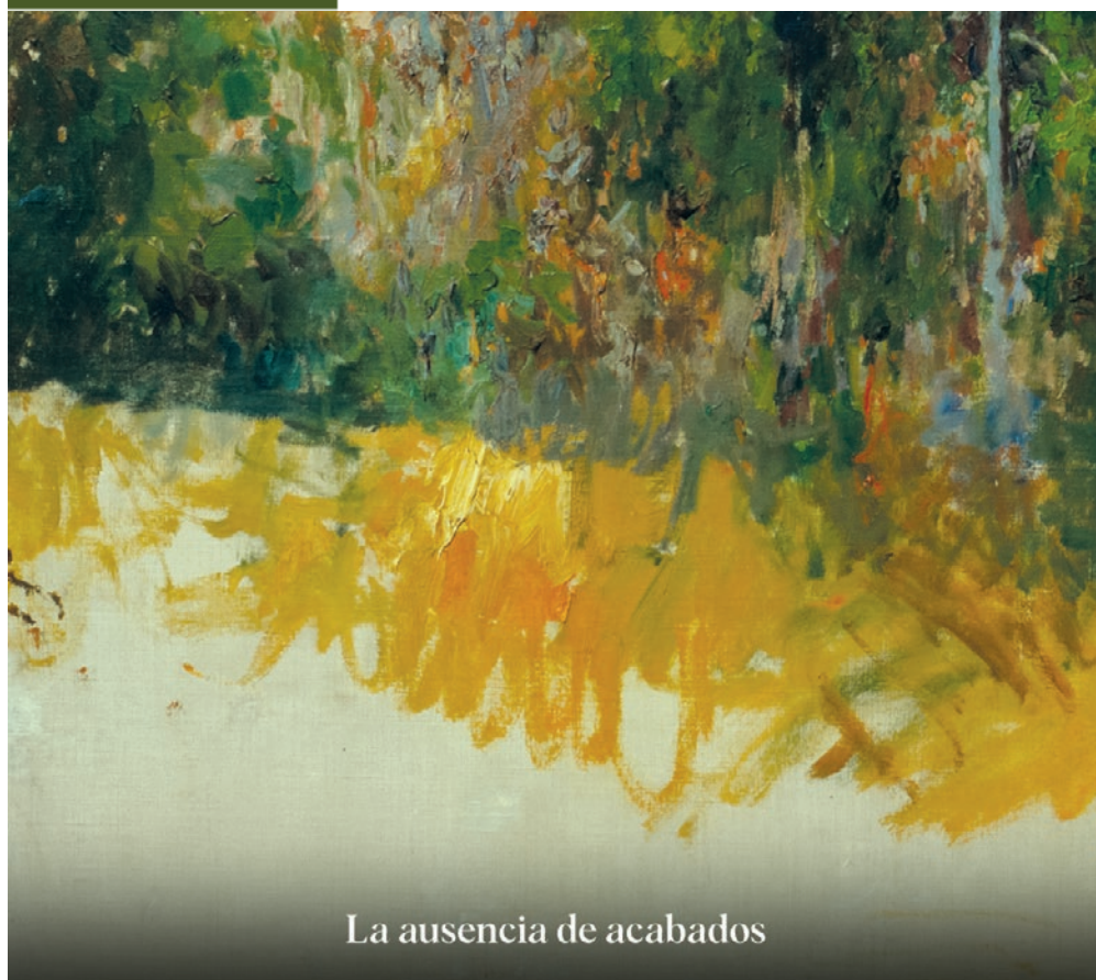
La ausencia de acabados