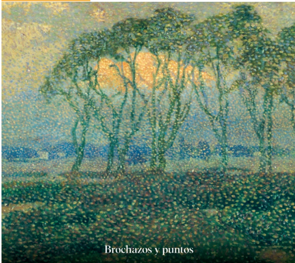
Brochazos y puntos