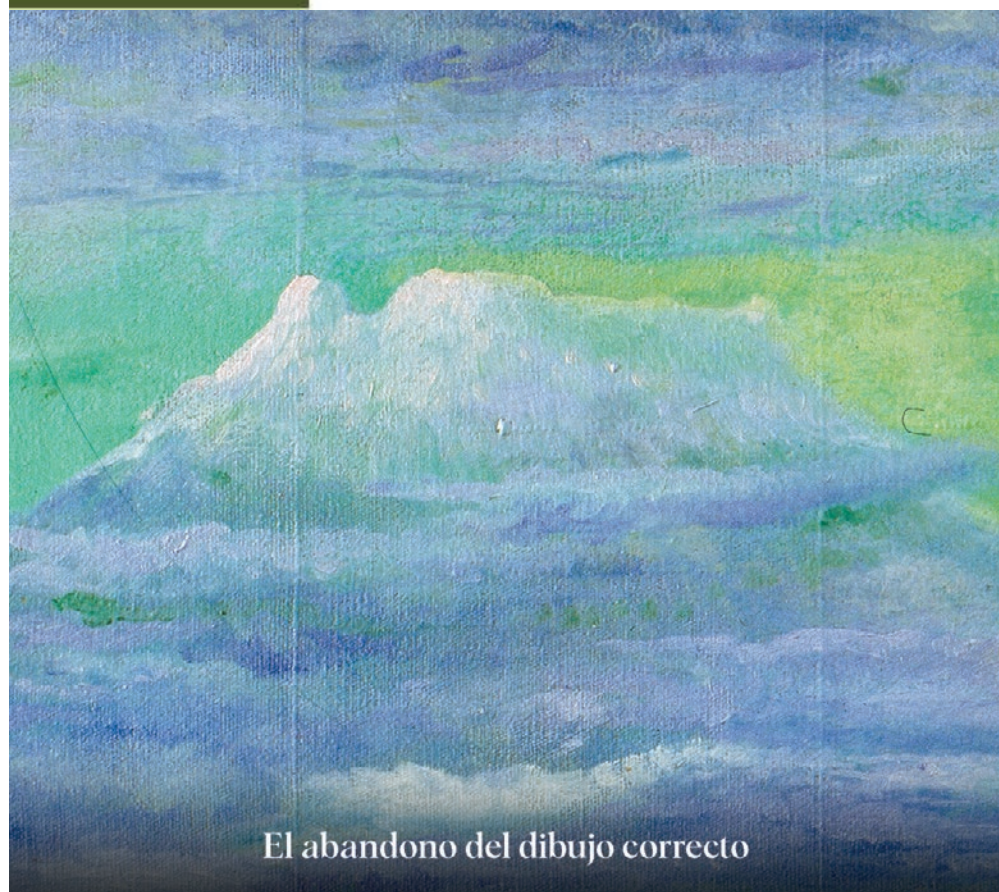
El abandono del dibujo correcto