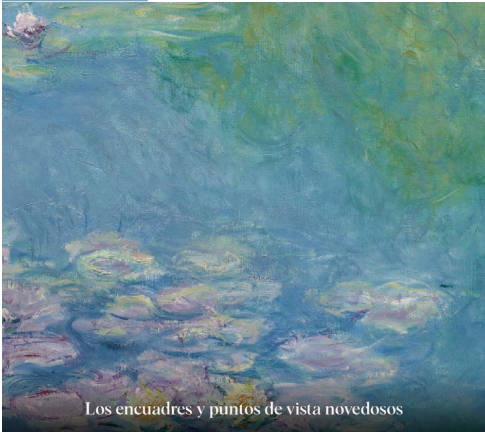
Los encuadres y puntos de vista novedosos