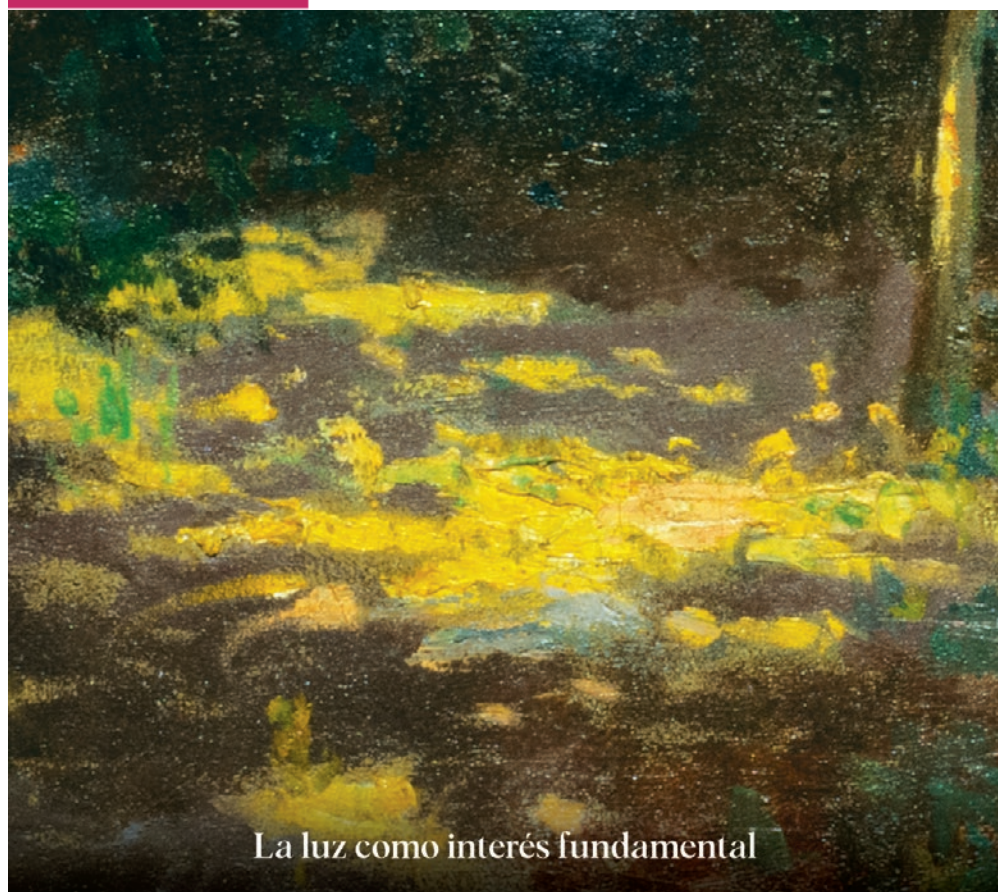
La luz como interés fundamental