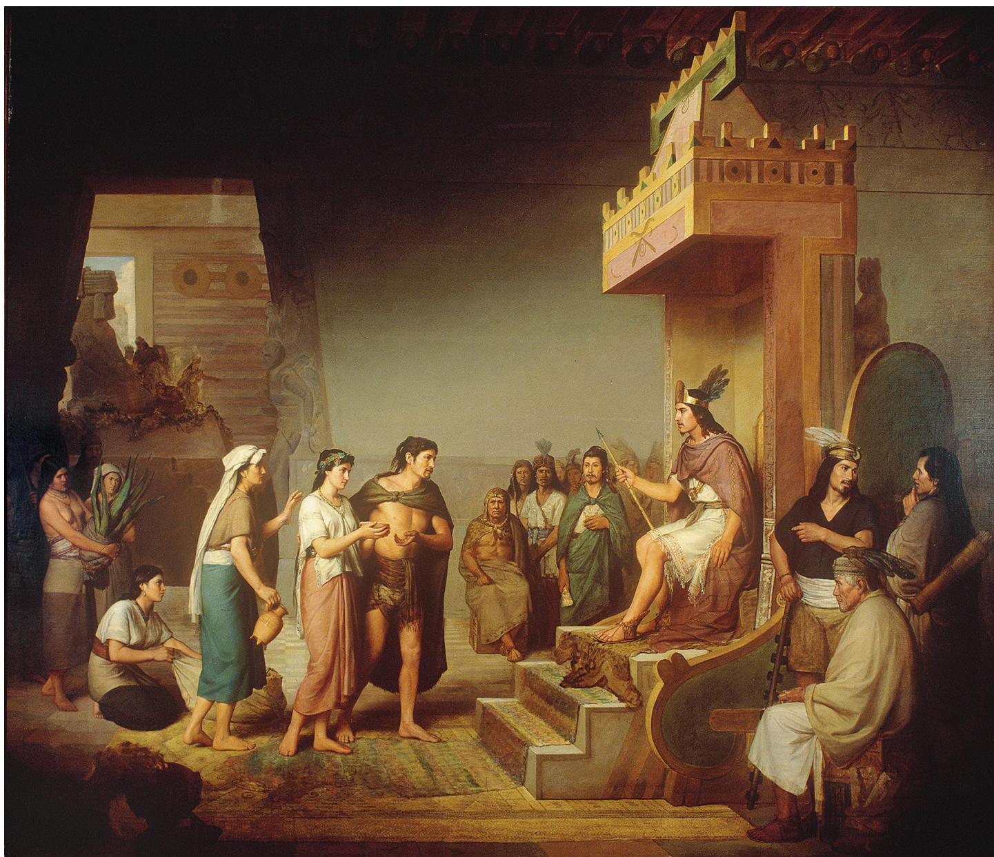
El descubrimiento del pulque - José María Obregón, 1869

5. Conferencia magistral de cierre: Constelaciones de la memoria. Grandes reflexiones – 4 de mayo Ponente: Mtro. Alfonso Morales Carrillo, curador de la exposición