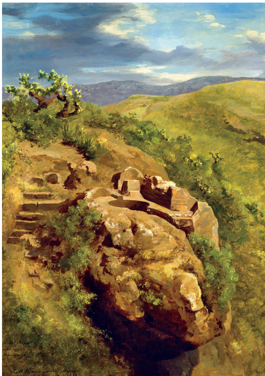
Baño de Nezabualcóyotl - José María Velasco, 1878