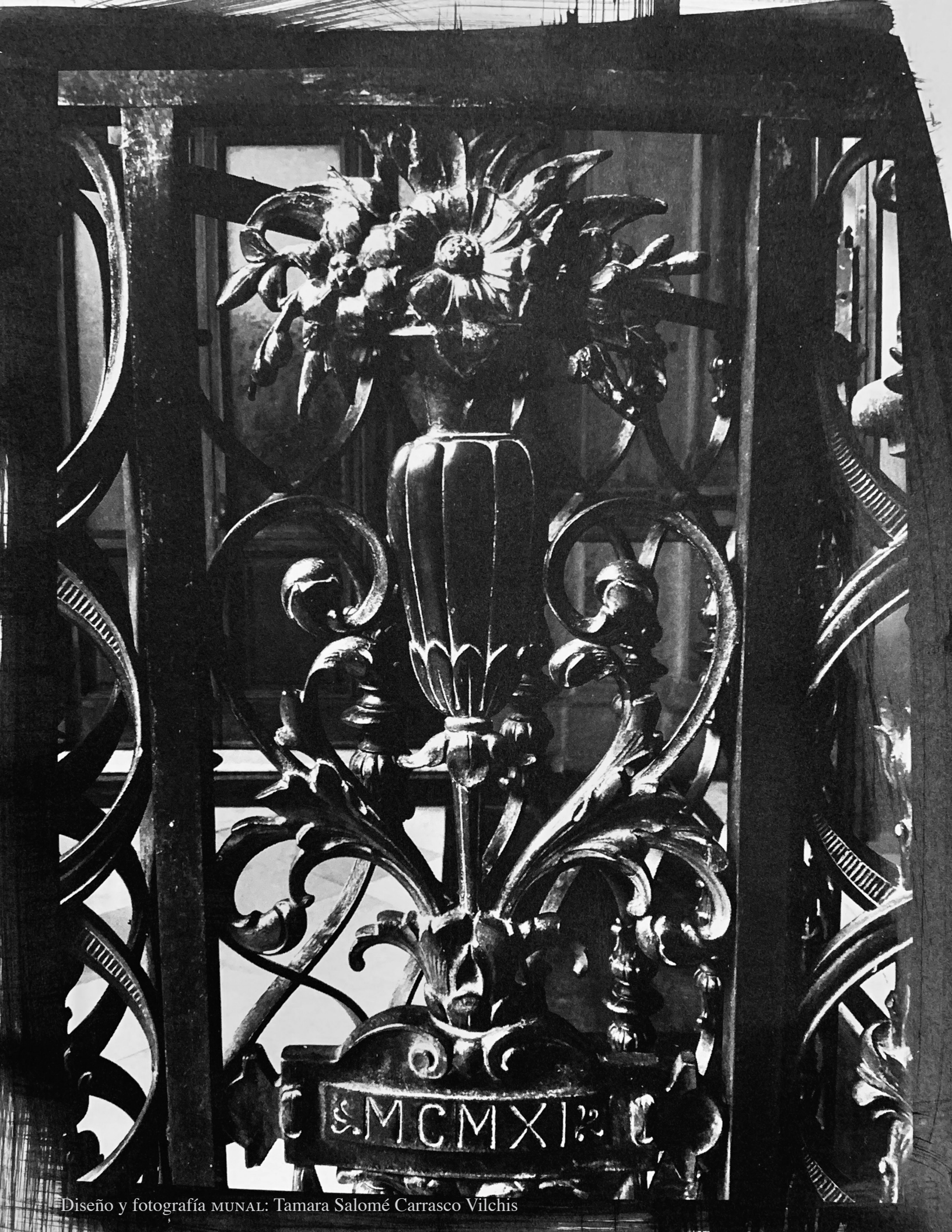
Diseño y fotografía MUNAL: Tamara Salomé Carrasco Vilchis